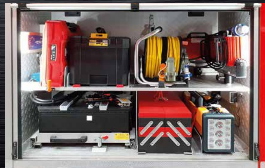
Kompakti koko - helppo säilyttää