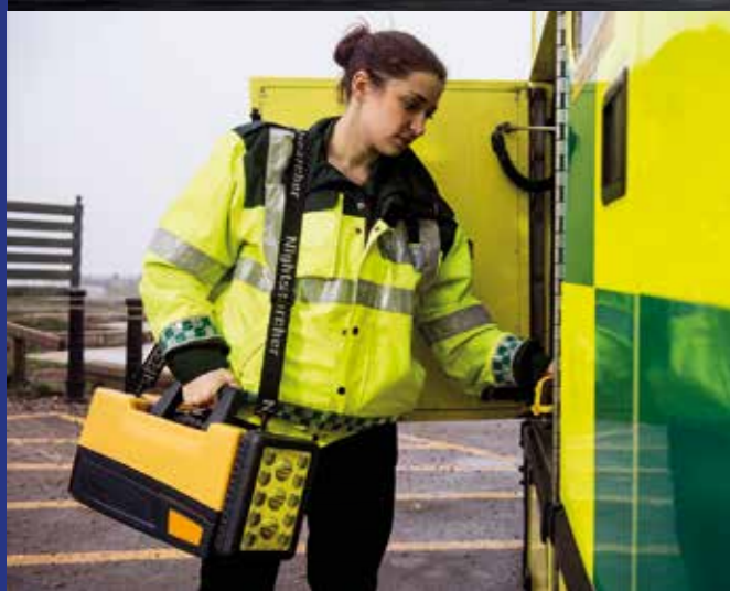
Helppo kuljettaa kevyen painon ansiosta

Toimitukseen sisältyy: Verkkolaturi ja olkahihna Valinnaiset lisävarusteet: Ajoneuvolaturi: CHIC16-8V4A-12-30V | Vakautustapit: SPTRIPDPEGS Kokoontaitettava aurinkopaneelilaturi: SPSOLARPANEL